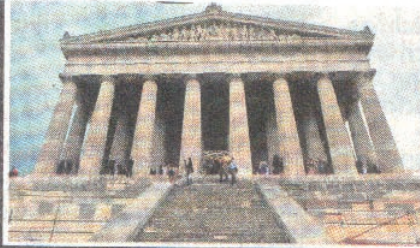
▲ Die neue Heimat der Heinrich-Heine-Büste: die Ruhmeshalle Walhalla bei Regensburg

Dass nach dem kleinsten Gezänk um die Finanzierung von 75 000 Euro gestern Düsseldorfer Kommunalpolitiker, bei diesem wunderbaren Festakt fehlten, fiel keinem auf. Im Gegenteil: Sie hätten nur gestört.